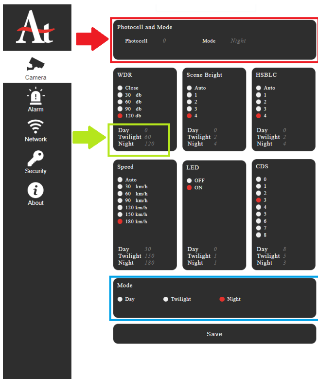
شکل شماره شش