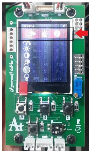
شکل شماره دو