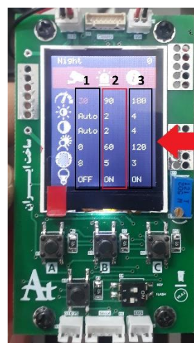
شکل شماره سه