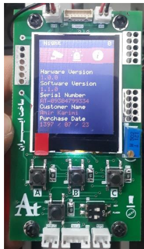
شکل شماره پنج