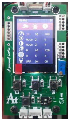
شکل شماره یک