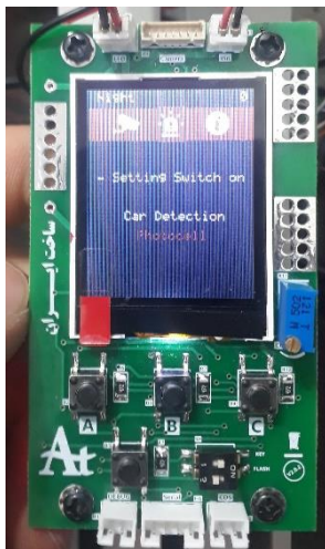
شکل شماره چهار